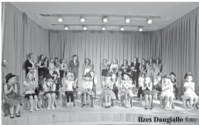
Ilzes Daugiallo foto

✓Ērgļu vidusskolā jaunajā mācību gadā mācības uzsākuši 237 skolēni, tai skaitā 18 pirmklasnieki un 14 10. klases skolēni. Skolā strādā 19 pedagogi un 12 tehniskie darbinieki.