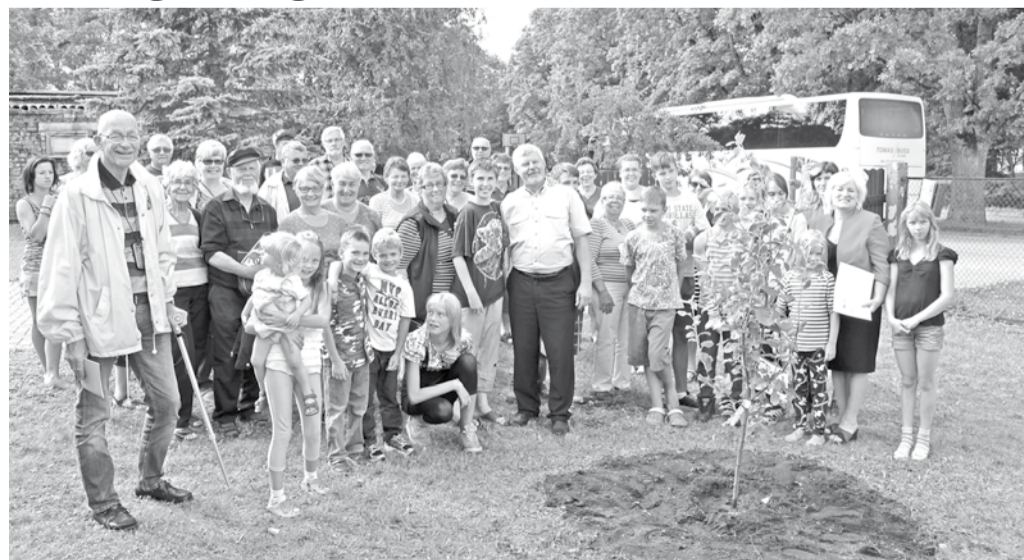
Kopā ar viesiem pie stādītās ābelītes.

Ģimenes atbalsta centra „Zīļuks” audzēkņu un darbinieku vārdā - R.L.Zeiferte