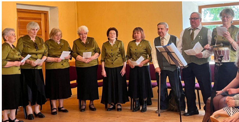
Uzstājas folkloras kopa „Pulgosnieši”