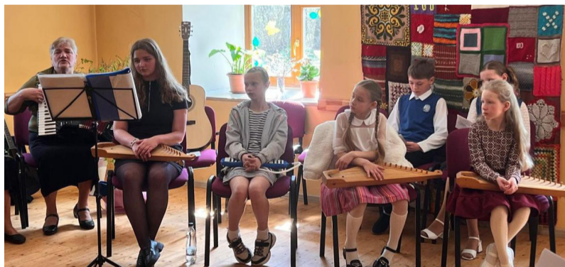
Koncertā piedalās bērnu folkloras kopa „Puzuriņi”