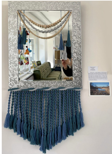
kojies spoguļi, veido šo stāstu. Mūsdienās teju ikviens kā vis-

Nesen aizvadītajā skolēnu radošajā konkursā piedalījās ar unikālu sienas spoguļi, kura mezglējumi un detaļas stāsta stāstu par mūsu pašu Ogres upi un cilvēkiem Madonas novadā. Ideja par darbu radās, vērojot Latvijas dabu – Ogres upes straumi un dažādos akmeņus, kuros tā rotaļājas. Spoguļa sudrabainais rāmis uzreiz saistījās ar saulē zaigojošu ūdens virsmu, bet koka pērlītes – ar upes gultnes gludajiem akmeņiem. Darbā iestrādātas simts koka pērlītes, kas simboliski atspoguļo arī Madonas simtgades stāstu, tāpat ikviens, kurš ieļū-