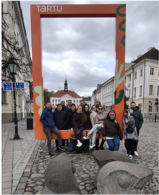
ciens ārpus Latvijas. Divu dienu laikā dejojāji ne tikai pārstāvēja Ērgļus

un Latviju, bet arī stiprināja kolektīva garu un iepazīna viens otru vēl tuvāk. Kā paši dejojāji smeļ – lai kļūtu par īstu komandu, kopā jāizbrauc ceļojumā un kopīgi jāiziet cauri dažādiem piedzīvojumiem.