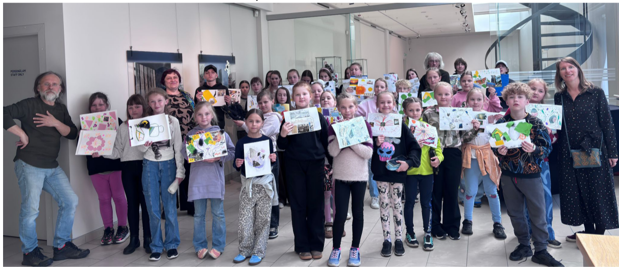
Ērgļu Mākslas un mūzikas skolas audzēkņi un skolotāji mācību ekskursijā

Pēc Valsts svētku brīvdienām notika Ērgļu MMS mākslas nodaļas LIELĀ mācību ekskursija. Tas nozīmē, ka ekskursijā dodas visi četrdesmit mākslas nodaļas audzēkņi un visi mākslas skolotāji. Neieradās tikai daži audzēkņi slimības dēļ.