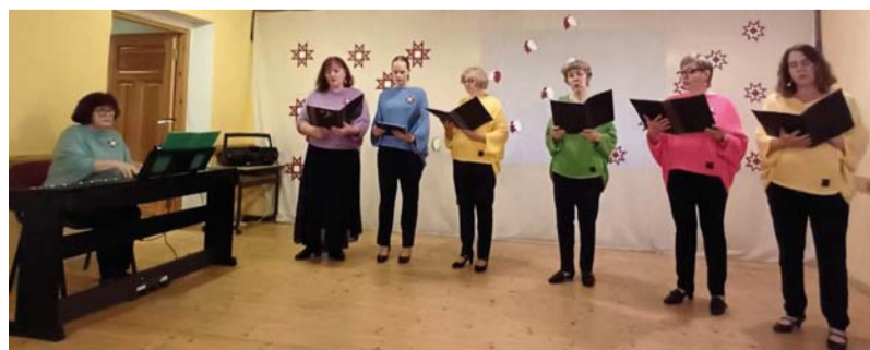
Dzied Vietalvas pagasta sieviešu vokālais ansambļis.

nesumi iekrāsoja mūsu ikdienu, padarot to svinīgāku, īpašāku. Paldies skatītājiem par klātbūtni, par atbalstu ar aplausiem un labajiem vārdiem! Dzīvojot līdzi zālē notiekošajiem priekšnesumiem, baudījām svinīgo atmosfēru un cilvēku labvēlību. Arī šogad valsts svētki Sausnējā noritēja godam, jo kopīgi svinot, apliecinājām cieņu Latvijas valstij.