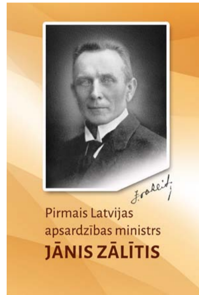
Pirmais Latvijas apsardzības ministrs JĀNIS ZĀLĪTIS