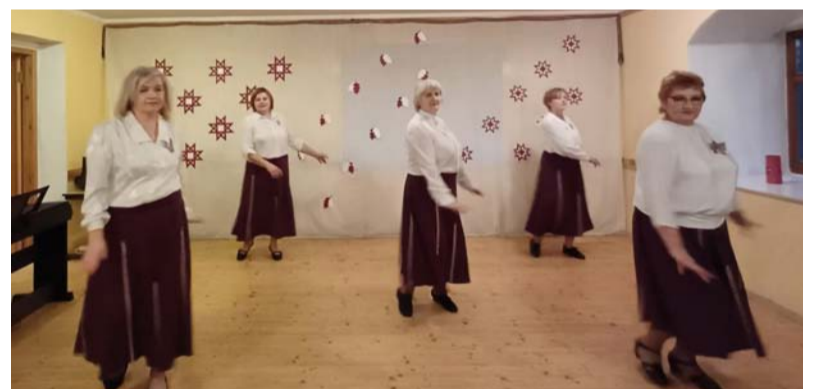
Deļo Sausnējas dāmu līnijdeļu kopa „Dzīvojam deļā”.