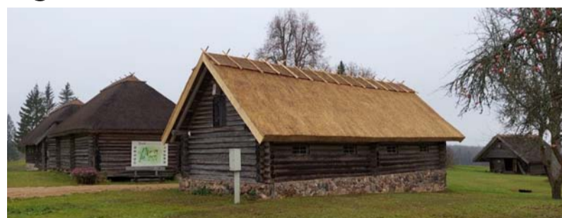
Brakos siklopu kūtij jauns jumts.

Rudens ir īpašs ar to, ka oktobrī tiek iesūtīti R. Blaumaņa literārās prēmijas 20. konkursa domraksti. Šogad esam saņēmuši 174 darbus no dažādām Latvijas vietām. Prieks par skolēnu vēlmi izziņāt, pētīt un iedzīvināt rakstnieka R. Blaumaņa dzīvesgājumu un daiļradē. 7. decembrī notiks konkursa apbalvošanas pasākums, kurā cildināsim labākos rakstītājus un viņu skolotājus. Sarīkojumu vadīs