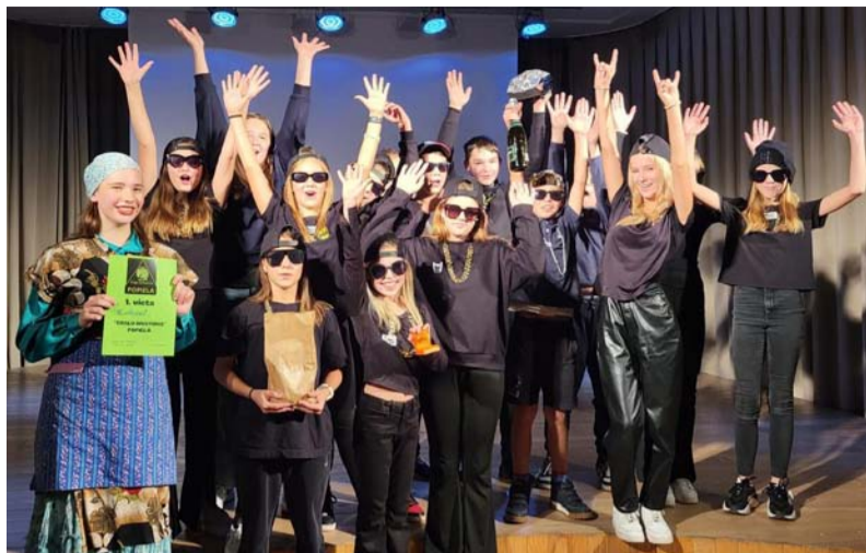
1. vietas ieguvēji.

Pirms rudens brīvdienām, 18. oktobrī, skolēni noslēdza 1. semestra pusi ar liksmu ballīti. Skolā notika popiela „Ērgļu divstūris”. Skolēnu dome piedāvāja attēlot grupas „Bermudu divstūris” populārākās dziesmas. Tā dzied gan latviešu, gan angļu valodā. Pasākuma nosaukums veidojās no grupas un Ērgļu pagasta vārdiem.