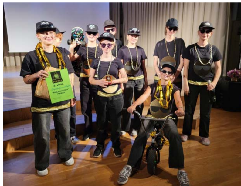
3. vietas ieguvēji.