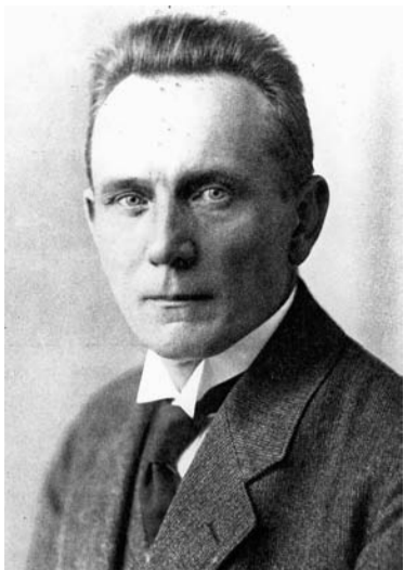
Pirmās Latvijas Pagaidu valdības apsardzības ministrs Jānis Zālītis.