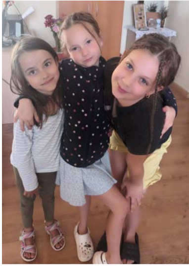
Aktīvie bērni vasarā Jumurdas bibliotēkā