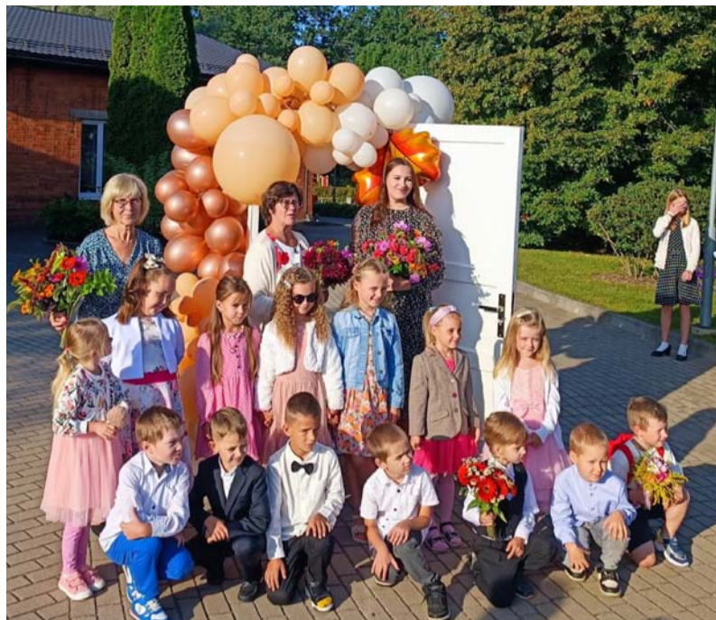
2024./2025. mācību gada izlaiduma grupiņa „Zaķēni”