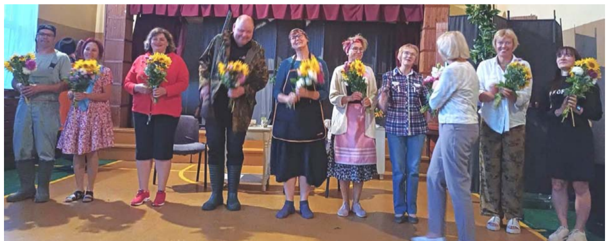
Liezēres amatierteātra aktieri pēc izrādes „Šauj viņu nost!” Sausnējā.

Sausnējā ir iecienītas teātra izrādes, kuras mums piedāvājuši dažādi dramatiskie kolektīvi un amatierteātri. Nebijis gadījums - Sausnējā ieradies „Savēdējs”! Tas notika 14. jūnija pievakarē, kad pie mums viesojās Vietalvas un Odzijas dziedāšanas biedrības amatierteātris ar Monikas Zīles izrādi „Savēdējs”.