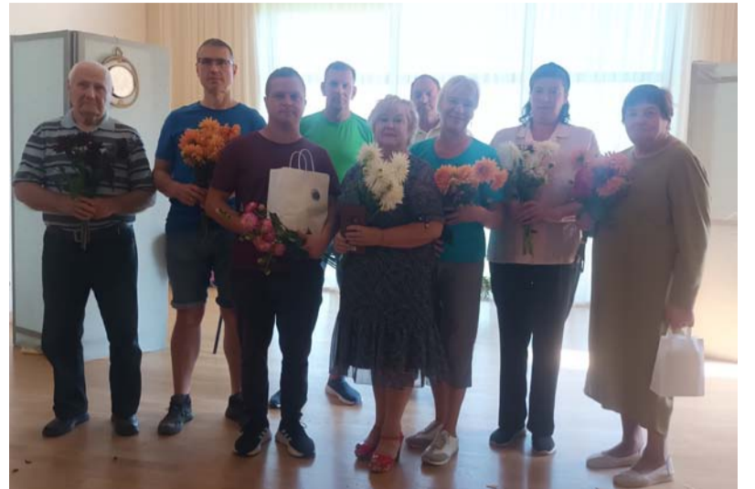
Lauteres kultūras nama amatiereteātra „Aronieši” kolektīvs