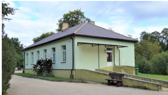
Ēka Parka ielā 5 – A. Braķes ģimenes ārstes prakse, 2021. gads.