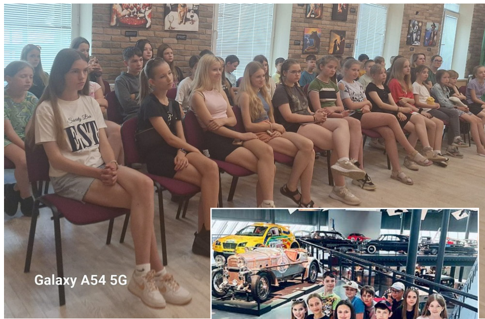
Galaxy A54 5G

Kā noslēdzošais ekskursijas posms bija Kangaru dabas taka, kur mēs baudījām skaisto Latvijas dabu. Cik bailīgi un interesanti bija vērot apkārtni no 33 metrus augstā skatu torņā!