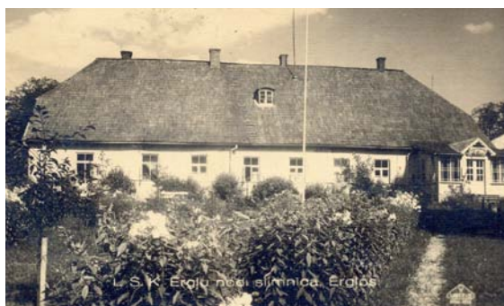
Latvijas Sarkanā Krusta Ērgļu nodaļas slimnīca, 1938. gads.

1964. gadā uzcelta jauno slimnīcu. Vecajā ēkā palika terapijas nodaļa. Bērnu nodaļu un bērnu konsultāciju iekārtoja bijušās