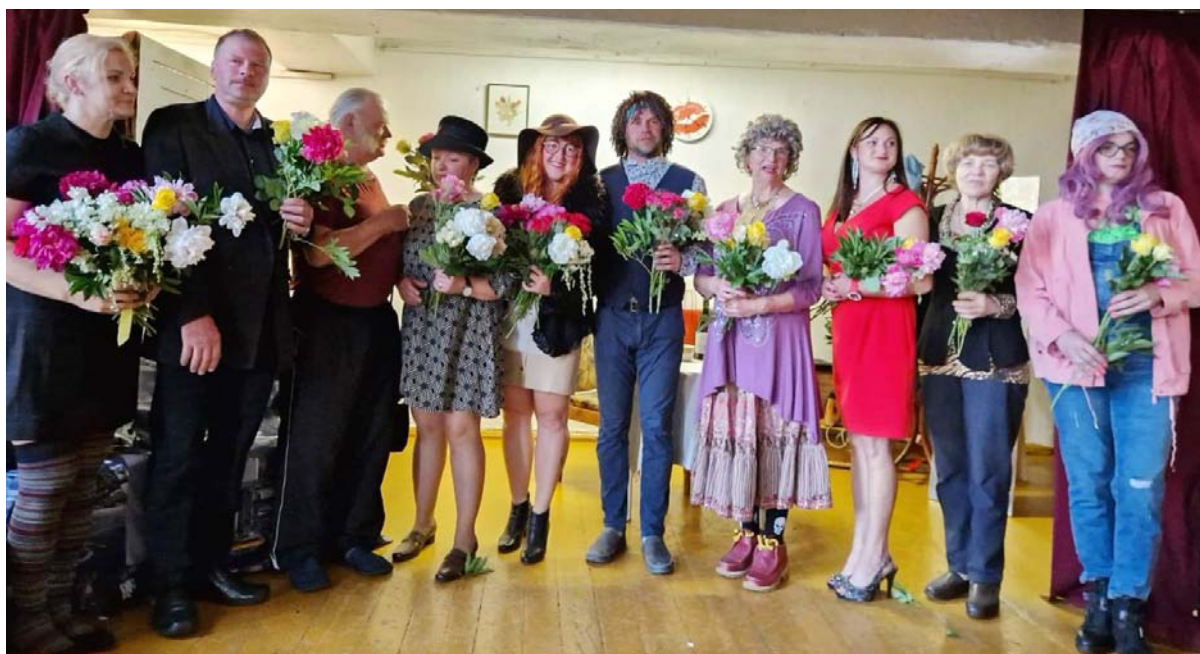
Vietalvas amatiereteātra aktieri pēc izrādes „Savedējs” Sausnējā.

Bijušās Sausnējas pamatskolas zālē kuplā skaitā pulcējās teātra mīļotāji, lai noskatītos šo izrādi ar ļoti intriģējošo nosaukumu. Līdz izrādes sākumam zālē gandrīz visas skatītāju vietas bija aizņemtas, par ko liels prieks gan aktieriem, gan publikai. Bija ieradusies skatītāji ne vien no Sausnējas pagasta, bet arī no vairākiem kaimiņu pagastiem, novadiem un pilsētām. Tas ir apliecinājums apgalvojumam, ka latvieši ir lieli teātra mākslas cienītāji un čakli izrāžu apmeklētāji. Tas ir arī pierādījums amatiereteātru augstajai profesionalitātei un aktieru meistarībai. Par to pārliecinājamies, noskatoties šo izrādi.