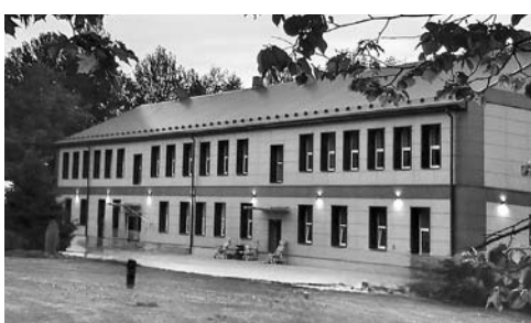
Bijusī Liepkalnes skola tikšanās priekšvakarā – 2024. gada maijā.

mīļajām, atkal dziedāšanai nobriedušajām skolas liepām. Liepas tās pašas, bet skola pretī pavisam cita – renovēta, moderna. „Šī ir mūsu skola!” sacīja daudzi, kā dāvanu saņēmuši magnētiņu ar baltos ķieģeļos tērpto divstāvu ēku, par kuru