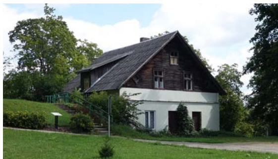
Kādreizējā zobārstniecības ēka, 2021. gads.

dzemdību nodaļas telpās. 1974. gadā bērnu nodaļu paplašināja, jo bērnu konsultāciju pārcēla uz nelielu ēku, kas atradās blakus poliklīnikai un kurā pirms tam ir bijis apsarga namiņš, jo ēka Parka ielā 6 zināmu laiku piederēja Iekšlietu ministrijai. 1988. gadā bērnu nodaļas ēku (bijušais pavāra namiņš) nojauc un uz vecajiem pamatiem uzcelta jaunu. Īslaicīgi – pa remonta laiku – bērnu nodaļa tika pārvieto-