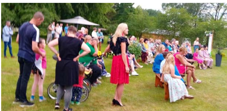
Tikšanās dalībnieki svinīgā pasākuma laikā.