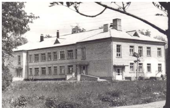
Ērgļu zonālā slimnīca, 1970. gadi.