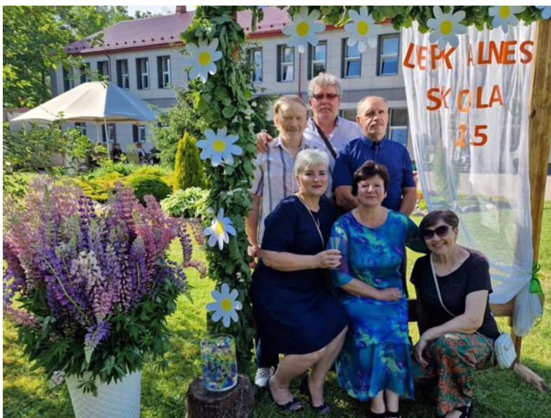
1979. gada absolventi ieradusies kuplā skaitā.

Kas 45 gadus pēc skolas durvju aizvēršanas šos klasesbiedrus tur kopā un liek satikties katru gadu, apciemot audzinātāju mājās un tagad jau kapiņos? To vislabāk zina viņi paši, bet, no malas raugoties, izskatās, ka tas ir skolas laikā iemācītās draudzības īstums, vārdu un darbu īstums, piedzīvoto grūtību un pieticības īstums. Viņu prieks par dzīvi, par to, ar ko bagāti ir šodien, putoja kopā ar dzirkstošo šampanieti, ko uz satikšanos, saskandinot ar glāzēm, baudīja ikkatrs atbraucūšais zem vecajam,