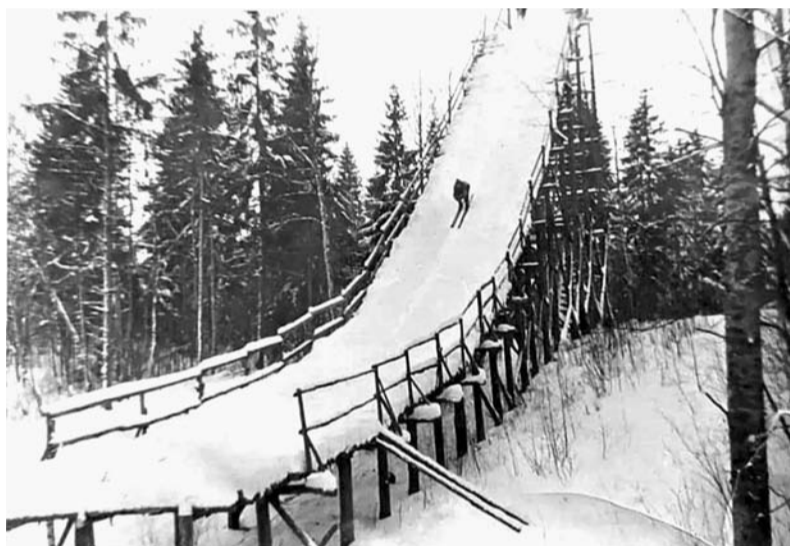
Briežkalna trampīns, 1970. gadi.