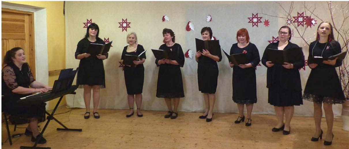
Dzied Iršu kultūras nama sieviešu vokālais ansamblis. Ingas Grotas foto

Paldies visiem svinīgā sarīkojuma dalībniekiem – mūziķiem, dejotājām, dziedātājām, daiļlasītājiem! Pateicamies kaimiņu novadu un pagastu talantīgajiem cilvēkiem, amatierkolektīvu dalībniekiem un kolektīvu vadītājiem! Jūsu priekšnesumi iekrāsāja mūsu ikdienu, padarot to svinīgāku, īpašāku. Paldies skatītājiem par klātbūtni, par atbalstu ar aplausiem un labajiem vārdiem! Atrodieties zālē un dzīvojot līdz svinību gaitai, baudī-