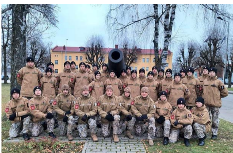
3. jaunsardzes novada – Vidzemes – pārstāvji gatavi militārajai parādei.

18. novembrī cēlāmies plkst. 8.00, pabrokastojām un izsoļojām mazu aplīti. Kad viss bija izdarīts, devāmies uz autobusiem un brau-