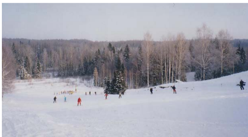
Slēpotāji Pārsteigumkalnā ap 2000. gadu.

las – laukums slidošanai un hokeja spēlei. No 2023. gada 8. decembra Briežkalns būs atvērts ziemas sporta veidu cienītājiem.