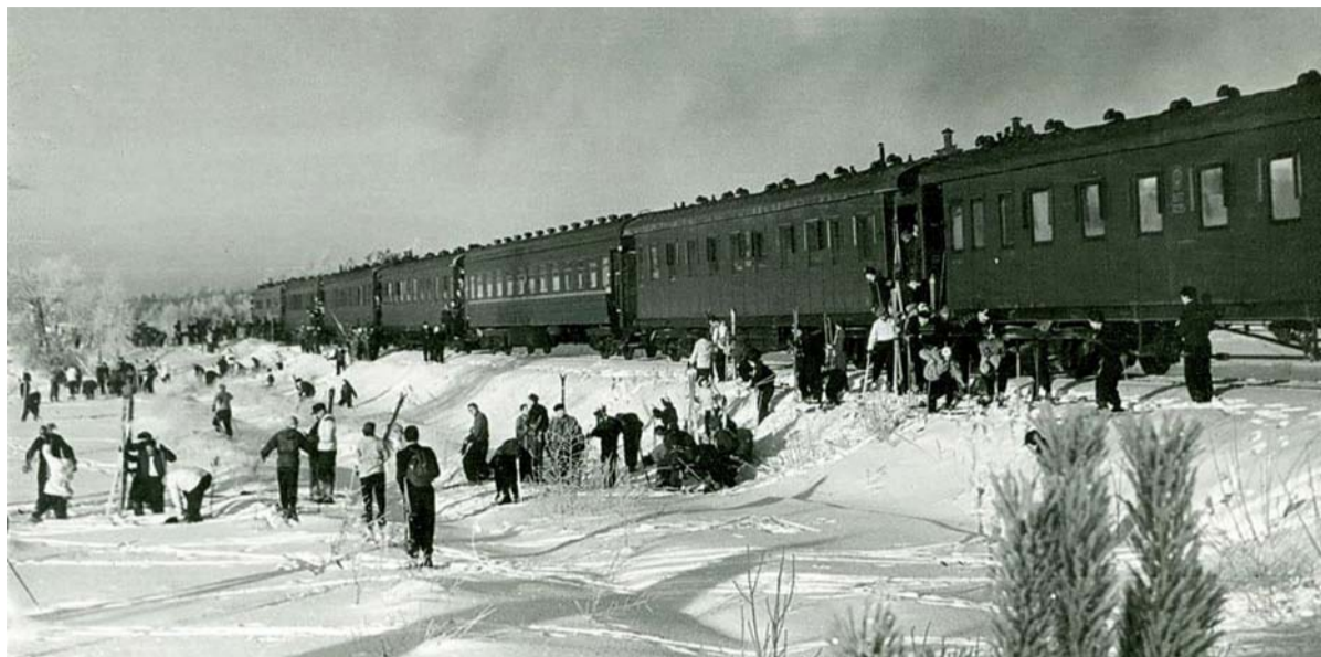
Slēpotāji Ērgļos, 1970. gadi.

Siltās ziemas, arī ekonomiskā situācija un krīzes negatīvi ietekmēja Ērgļu kalnu attīstību, kas uz ilgāku laiku pieklusa, arī skolās slēpošana notika fragmentāri. Pēdējos gados, ja laikapstākļi atļauj un ir sniegs, ar uzņēmīgu cilvēku rūpēm pie kādreizējās Ērgļu arodvidusskolas tiek iekārtota slēpošanas trase, bet pie Ērgļu vidussko-