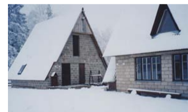
Ziemas atpūtas bāzes „Pārsteigumkalns” slēpju noma un kafējnīca, 1990. gadu beigās.