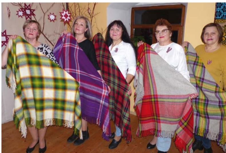
Dejo Sausnējas dāmu līnijdeju kopa „Dzīvojam dejā”.

jām svētku atmosfēru un cilvēku labvēlību. Ir pamats uzskatīt, ka svētki Sausnējā izdevušies godam, jo kopā mēs nosvinējām Latvijas dzimšanas dienu, kopā apliecinājām cieņu savai valstij.