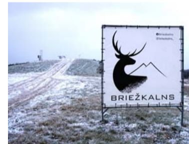
Briežkalns atdzimst, piedāvājot baudīt ziemas sporta priekus, 2023. gads.