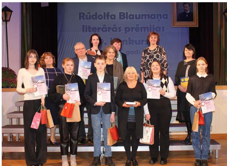
Laureāti, viņu skolotāji un žūrija.