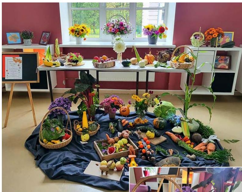
dzēja tapt kompozīcijām!

Vēlreiz paldies visiem dalībniekiem un vecākiem, kuri palī-