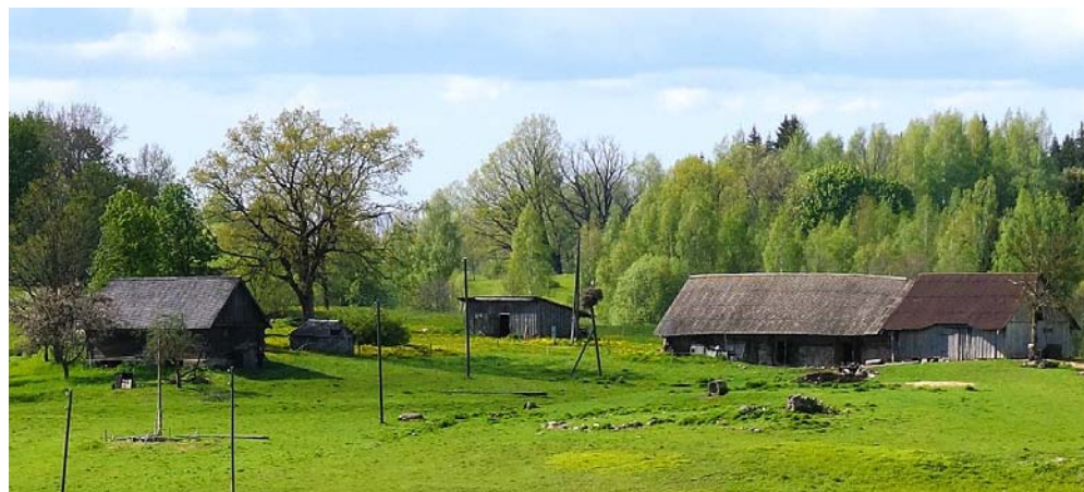
Skats uz „Kņapēnu” sētu, 2020. gads.