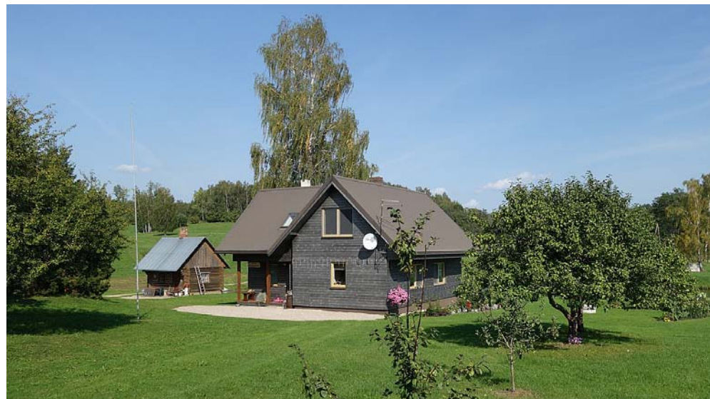
„Kalna Saimniecēnu” ēkas, 2023. gads.