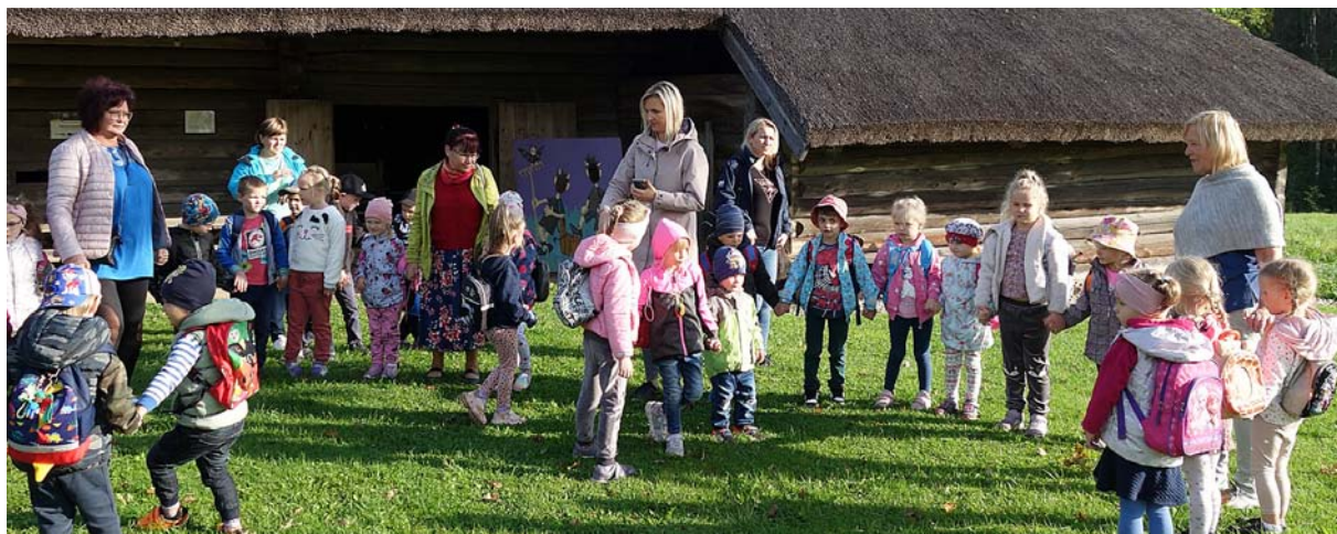
Rotaļās iet Kalsnavas pamatskolas bērni un audzinātājas.

29. septembrī – īstajā Miķeļdienā – „Brakos” ciemojās Kalsnavas pamatskolas pirmsskolas grupa, lai rudens saulgriežus nosvinētu senlatviskā vidē. Bērni bija iemācījušies dzejolišus par rude-