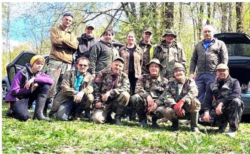
Meklēšanas vienība „Zvaigzne” 2023. gada maijā.

Runājot par Sausnējas un Liepkalnes apkārtnē notikušajām sīvajām kaujām, jāpiemin, ka šeit fronte turējās vairāk nekā trīs nedēļas, un piedzīvots liels upuru skaits abās pusēs. Tie varētu būt apmēram 1,5 tūkstoši, taču zinām, ka padomju pusē tika dota pavēle ziņot par krietni mazāku kritušo skaitu, izplatot sagrozītu informāciju. Esot bijušas tādas vietējās nozīmes kaujas, kuru rezultātā krituši visi abās pusēs karojošie, tādēļ nav neviena liecinieka. Nevaram uzklaut kara notikumu aculiecinieku stāstus, jo tā paaudze ir aiz-