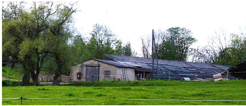
Kādreizējā „Paņķēnu” ferma, 2020. gads.