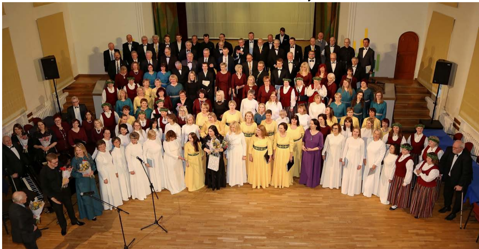
Pasākuma „Kori sadzied Ērgļos” kopkoris 2023. gada 1. aprīlī.

2023. gada 1. aprīlī plkst. 16.00 Ērgļu saietā namā izskanēja koncerts „Kori sadzied Ērgļos”, kas, protams, bija koku dziedāšanas pasākums ceļā uz Dziesmu svētkiem, jo visi gatavojamies šī gada atbildīgākajam kultūras notikumam – XXVII Vispārējiem latviešu Dziesmu un XVII Deju svētkiem. Kaut arī 1. aprīlis – Joku diena –, tomēr vēlme dziedāt bija visai nopietna, jo dziedātājiem jāsmējas iedvesma tālākai virzībai caur koku skatēm uz svētku noslēguma koncertu „Kopā Augšup” un koku lielkoncertu „Tīrums. Dziesmas ceļš”.