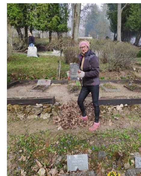
Talka Vējavā.