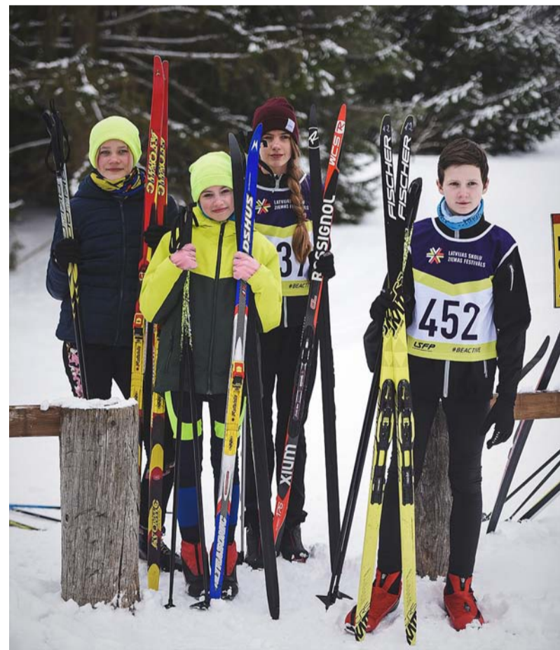
Ērgļu jaunie orientieristi Latvijas Skolu ziemas festivālā.

Ziema šogad bija savāda. Patmatīgs sniegs mījās ar lietu. Taču orientēšanās sacensības, kur nepietiek ar vienu trasi kā slēpotājiem vai biatlonistiem, bet jābūt krustu šķērso izveidotām trasēm visā meža teritorijā, izdevās noorganizēt. Vienīgi Latvijas čempionātu nācās pārcelt no Daugavpils uz Madonas novada Lubeju.