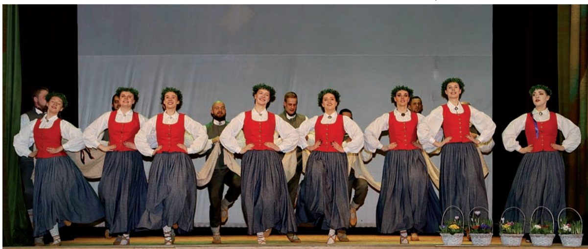
Deju kolektīvs „Rūdis”.