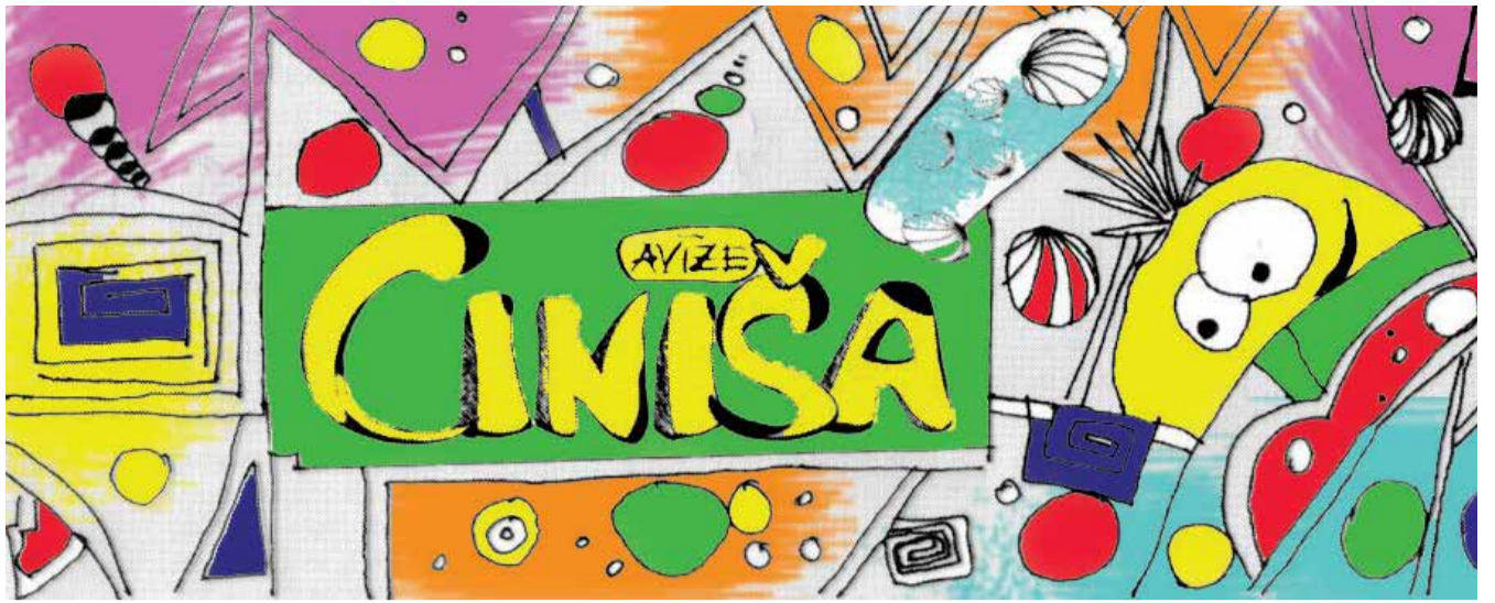
Skolas literārā avīze