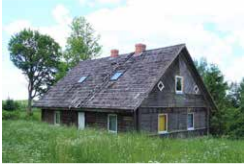
Mājas „Kalna Bākūži”, 2022. gads.