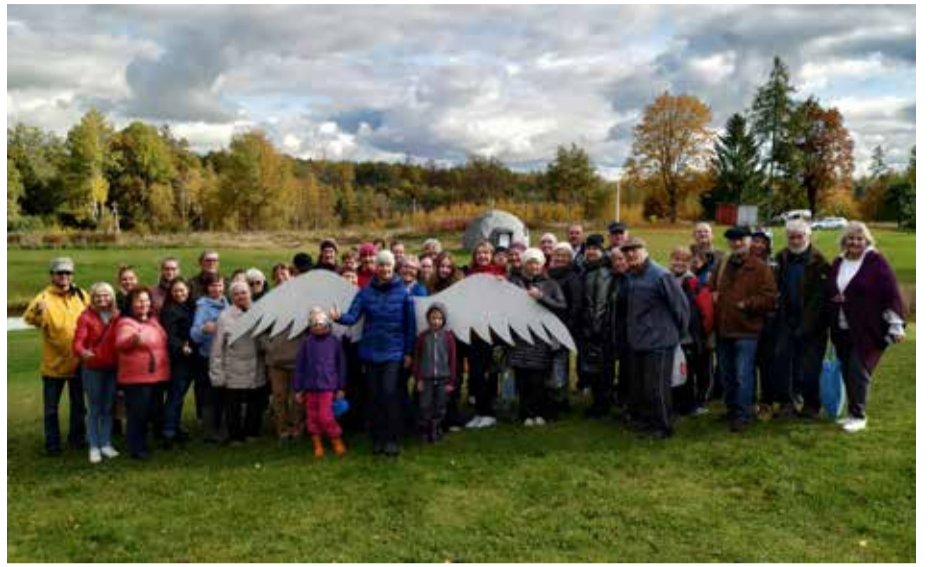
Tūristi viesojas radošās atpūtas pagalmā „Tiltiņi”.