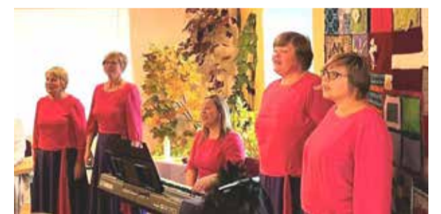
Dzied dāmu ansamblis „Ievziedi” no Jumurdas.