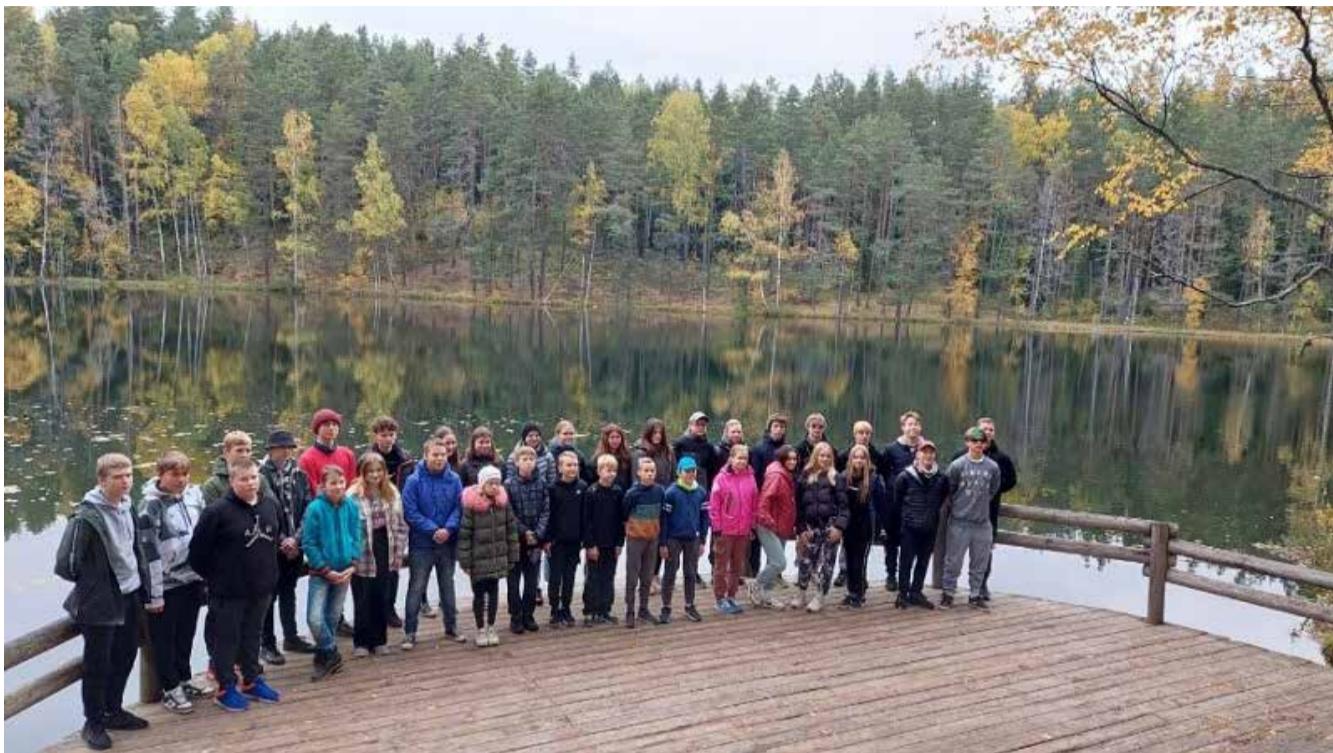
Madonas novada jaunsargi pie Velnezera.