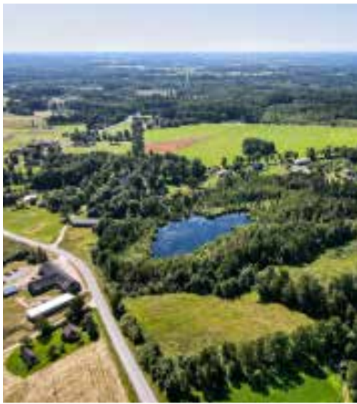
Sausnēja no putna lidojuma.