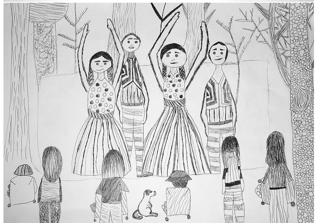
Rēzija Jirgensone, ĒMMS 4. kurss