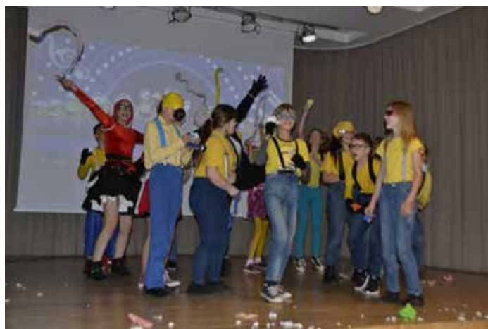
Uzvarētāju – 5. klases – priekšnesums.