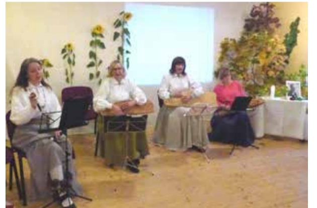
Koklētājas no Ērgļiem uzstājas svētku dalībnieku priekam.