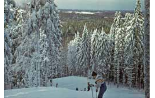
Bākūžkalna sagatavošana slēpošanai, 1980. gadi.