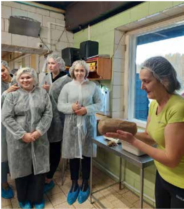
Ķelmēnu maizes ražotnē.

Mēs, Ērgļu vidusskolas bosī, kopā ar 9. klases skolēniem devāmies mazā piedzīvojumā uz Alūksni. Pa ceļam sanāca iebraukt un apskatīties “Ķelmēnu” maizes ražotni Raunas pagastā. Mūs sagaidīja laipns un radošs saimnieks. No sākuma mums izstāstīja, kā aizsākās šis bizness, pēc tam sekoja teritorijas apskatīšana. Un mums visiem liels pārsteigums bija lielā mašīnu kolekcija. Bija iespēja iekāpt un pasēdēt formulas automašīnā. Meitenes sajūsmīnāja sens busiņš, kas bija pārveidots, lai varētu doties tālajās ekskursijās. Pēc teritorijas apskatīšanas devāmies uz pašu maizes ceptuvi. Apskatījām procesu, kā top šī maize – no mīklas līdz iesaiņotam kukulītim veikala plauktā. Pēc apskates saimnieks mums dāvāja katram mazu dāvanīņu, kurā bija trīs svaigi maizes kukulīši.