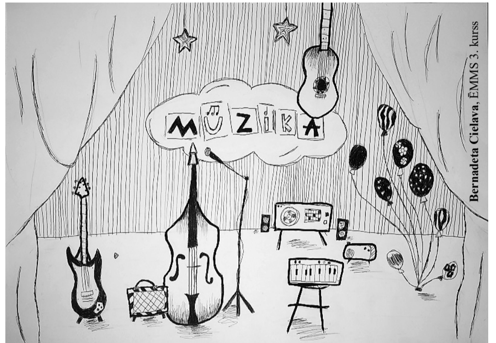
Bernadeta Cielava, ĒMMS 3. kurss