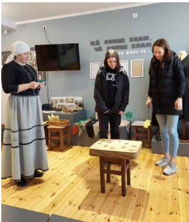
“Vārdu kaujas” Malēniešu muzejā.

Mēs, Ērgļu vidusskolas bosī, kopā ar 9. klases skolēniem devāmies mazā piedzīvojumā uz Alūksni. Pa ceļam sanāca iebraukt un apskatīties “Ķelmēnu” maizes ražotni Raunas pagastā. Mūs sagaidīja laipns un radošs saimnieks. No sākuma mums izstāstīja, kā aizsākās šis bizness, pēc tam sekoja teritorijas apskatīšana. Un mums visiem liels pārsteigums bija lielā mašīnu kolekcija. Bija iespēja iekāpt un pasēdēt formulas automašīnā. Meitenes sajūsmīnāja sens busiņš, kas bija pārveidots, lai varētu doties tālajās ekskursijās. Pēc teritorijas apskatīšanas devāmies uz pašu maizes ceptuvi. Apskatījām procesu, kā top šī maize – no mīklas līdz iesaiņotam kukulītim veikala plauktā. Pēc apskates saimnieks mums dāvāja katram mazu dāvanīņu, kurā bija trīs svaigi maizes kukulīši.