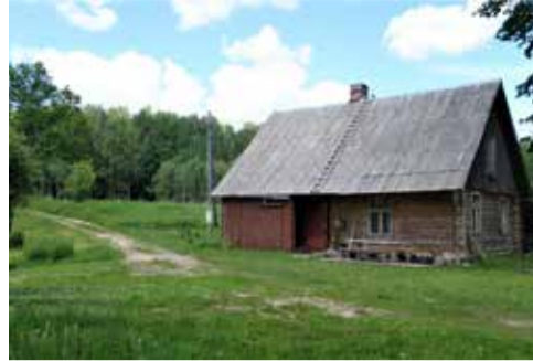
Mājas „Jaunbākūži”, 2022. gads.