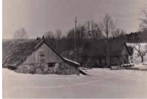
Skats uz „Bākūžu” sētu, 1960. gadu vidus. Foto no Patkovsku ģimenes personīgā arhīvā