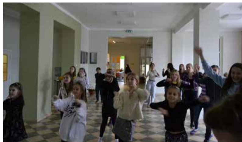
Sākumskolas skolēni “Just dance” ritmos.