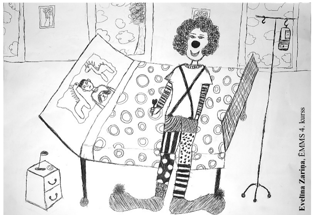
Evelīna Zarīna, ĒMMS 4. kurss