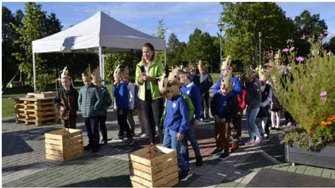
Kalsnavas arborētuma nodarbībā. 1. klase.

Cik gan grūti iesākt mācības pēc garās vasaras! Tāpēc katru gadu otrā mācību diena ir „iešūpošanās” darbam. Un tā 2. septembris sākās ar pavisam atšķirīgu stundu sarakstu, kur blakus ierastajām klases stundām bija – arborētums, mūzikas sajūtas, sīkmači, ugunsdrošība, lasi grāmatu, jaunieši darbībā, ģērbšanās stili, drošība un studijas.