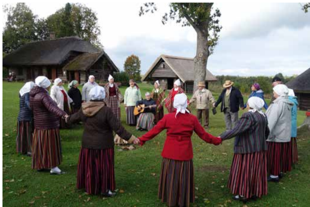
Miķeļdienas pasākums „Brakos”.