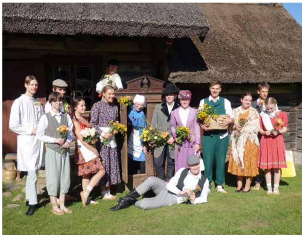
Valmieras jaunieši pēc izrādes „Trīnes grēki”.