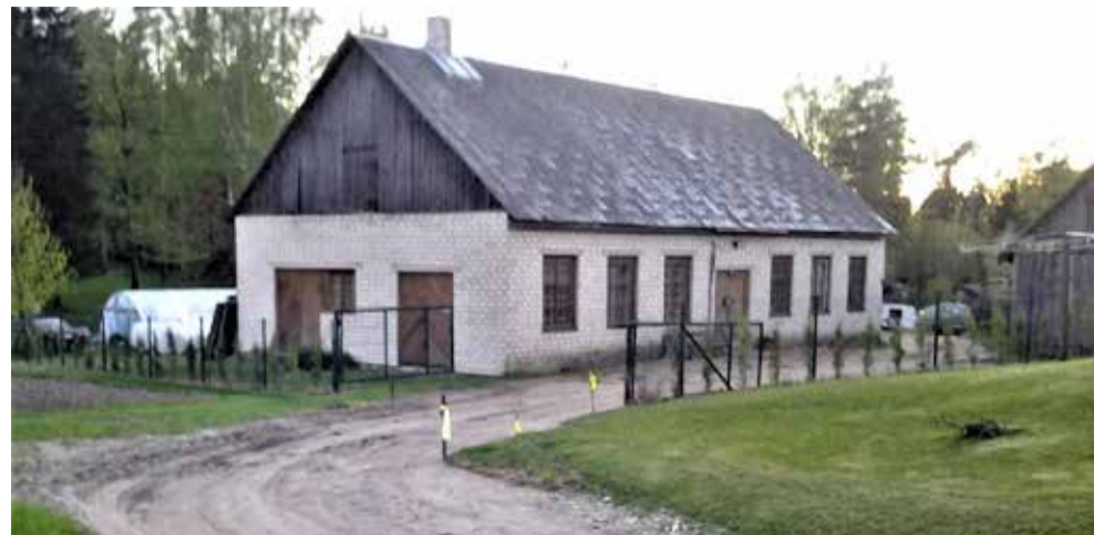
Bijusī žāvētava ap 2010. gadu.