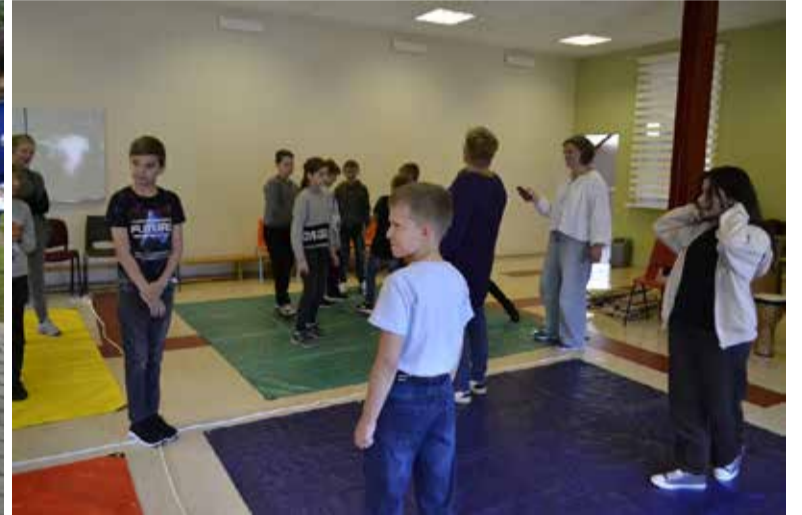
Mūzikas sajūtas. 5. klase.