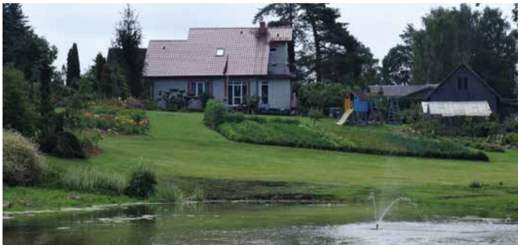
Skats uz „Dāvelnīša” sētu, 2022. gads.