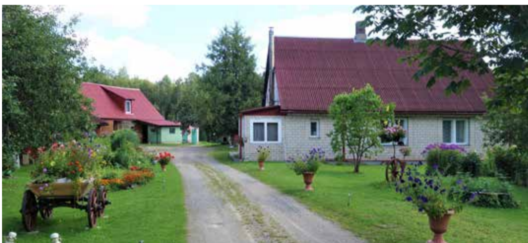
„Ceļmalas”, 2022. gads.