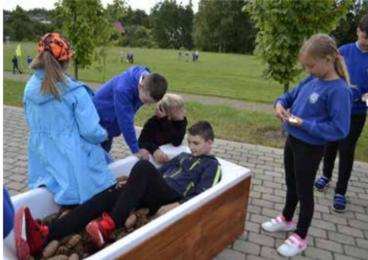
Čiekuru vannā. 4. klase.