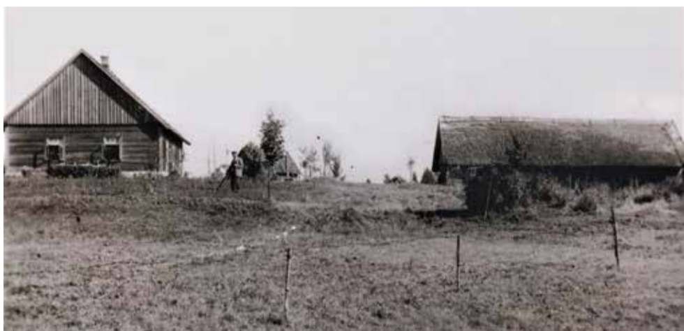
„Ceļmalu” ēkas, 1930. gadu vidus.