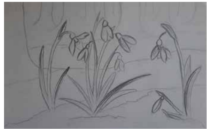
Līna Madsena, 7. klases skolniece