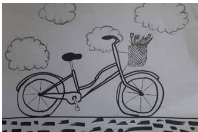
Evelīna Zariņa, 5. klases skolniece