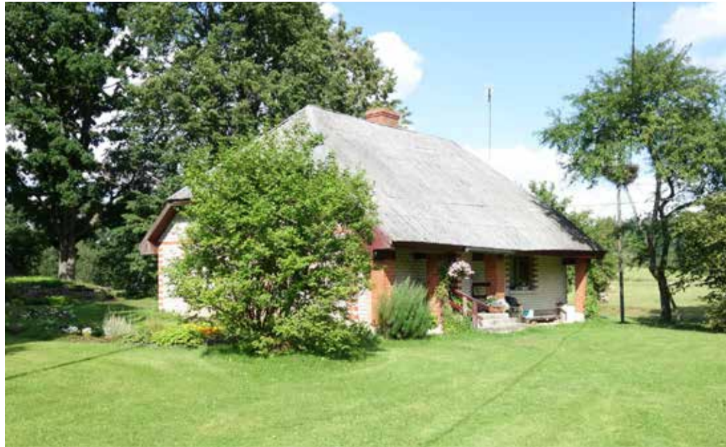
Mājas „Cūkāji”, 2020. gads.