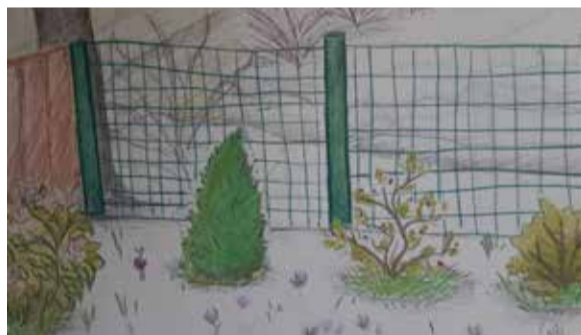
Patricija Dreiblāte, 7. klases skolniece