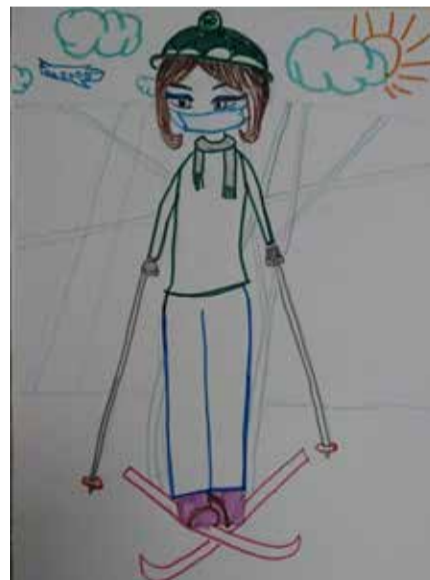
Keitlīna Kopštāle, 2. klases skolniece.