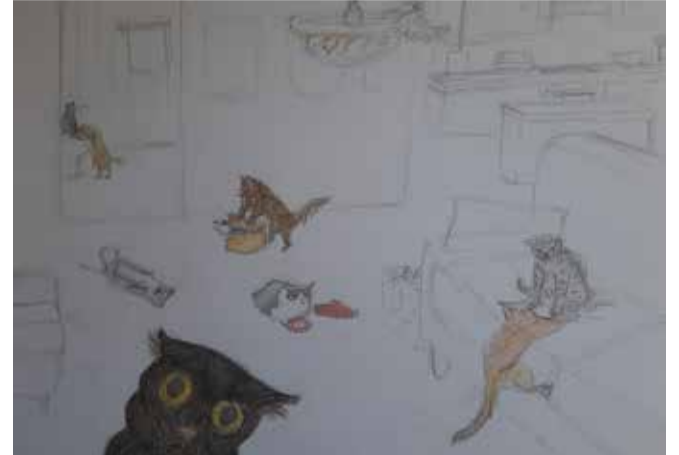
Patricija Dreiblāte, 7. klases skolniece