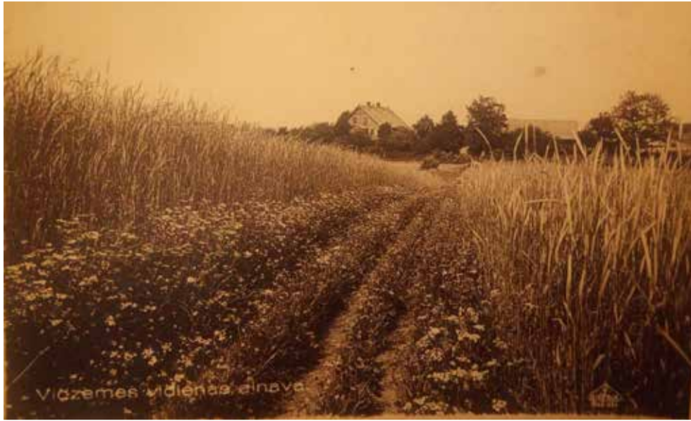
Skats uz „Pietrēnu” saimniecību. 1938. gads.