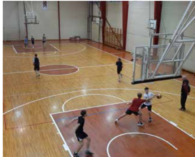
Basketbola spēles elementu noslīpēšana.