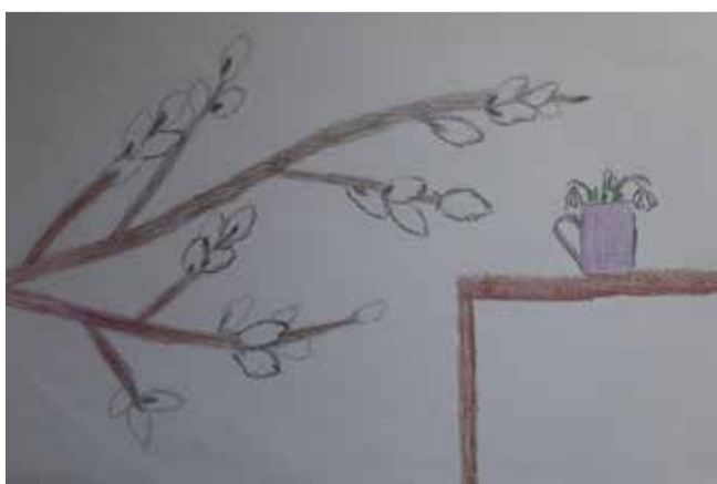
Krista Āboliņa, 7. klases skolniece