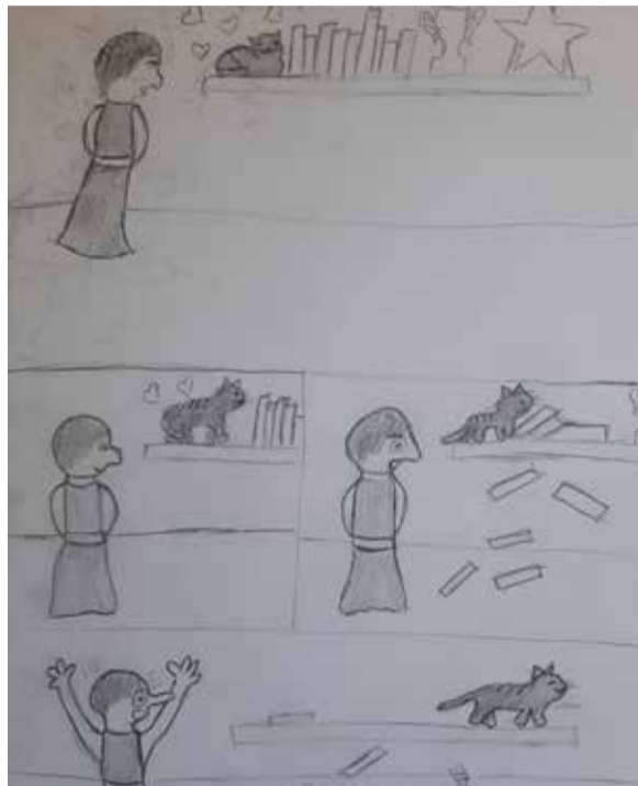
Līna Madsena, 7. klases skolniece