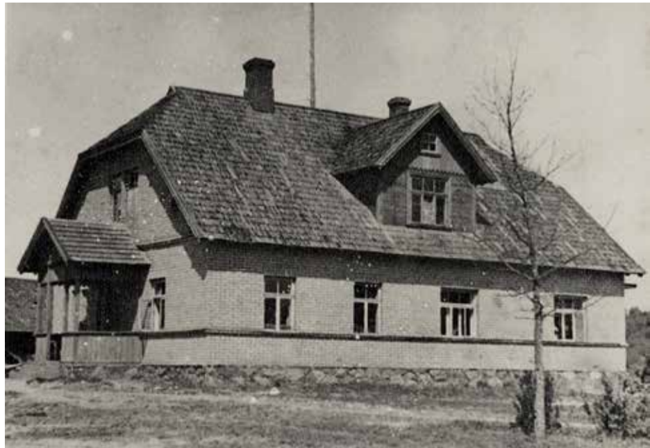
„Cūkāju” skola, 1945. gada novembris.