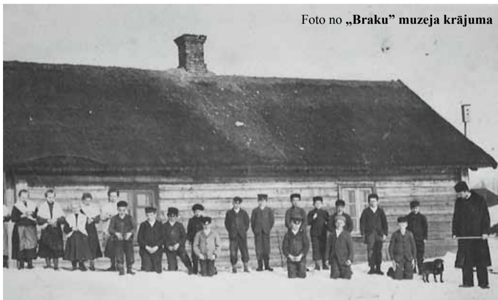
Katrīnas skola „Lejas Kreveļos”, 1914. gads.