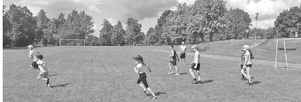
Apģūstot futbola pamatelementus.

Beidzoties neierastajam mācību gadam, tomēr orientēšanās treniņi nebeidzas arī jūnijā.