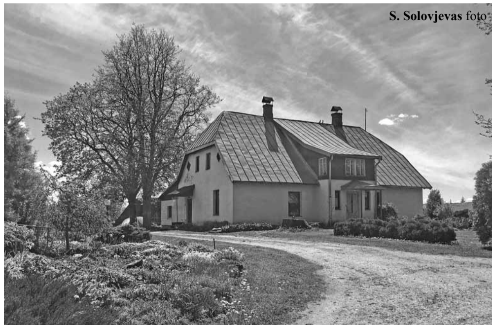
Mājas ”Luksti”, 2020. gads.