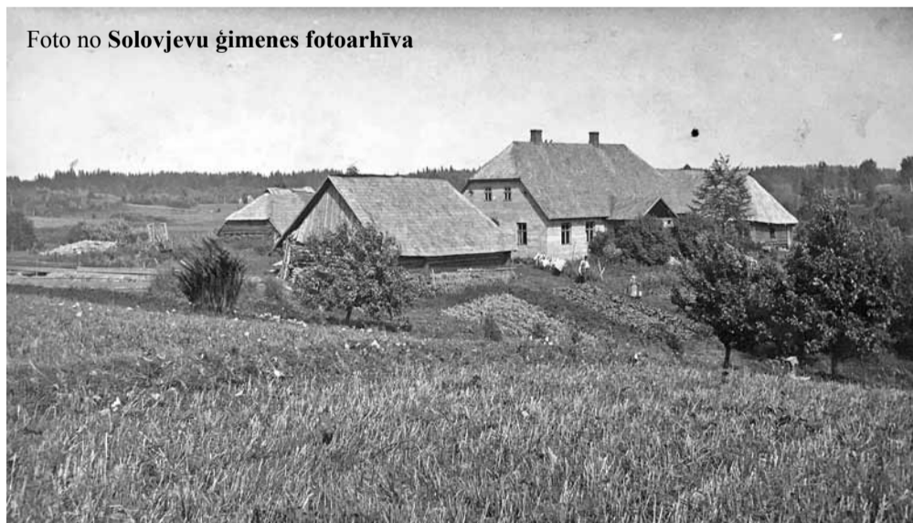
”Lukstu” saimniecība, 1930. gadi.