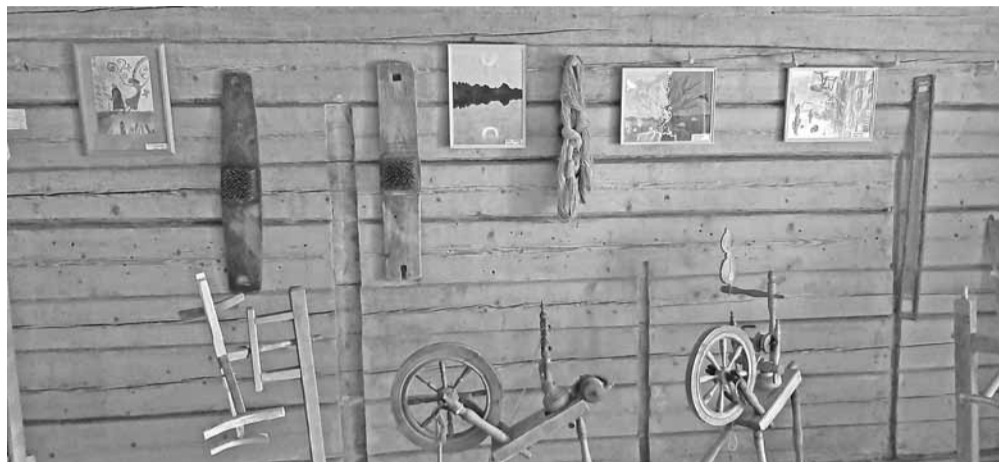
Ieskatš Ērgļu vidusskolas un Ērgļu mākslas skolas audzēkņu darbu izstādē „Robežas”.