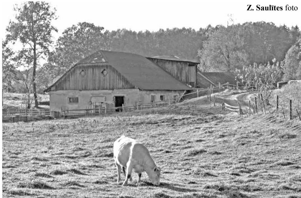
Kūts, kas būvēta uz „Andrupu” dzirnavu mašīnu mājas pamatiem, 2020. gads.