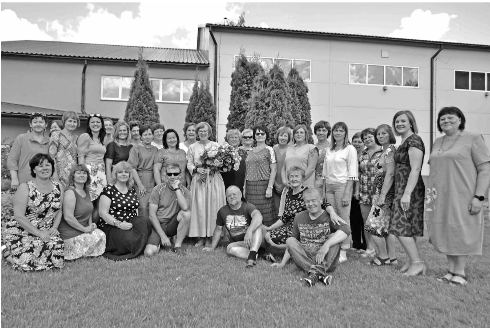
Skolas darbinieku kolektīvs mācību gada noslēgumā.

Nākamais mācību gads, kad, cerams, skolotājiem un skolēniem beidzot būs iespēja mācīties skolā, rādīs patieso ainu, ko reāli skolēni ir apguvuši. Skolotāji pašreiz uzskata, ka nāksies soli atkāpties, vēlreiz iedziļināties mācību