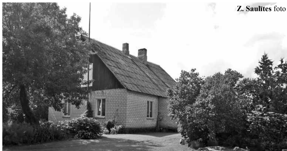
Mājas „Jaunogres”, 2020. gads.