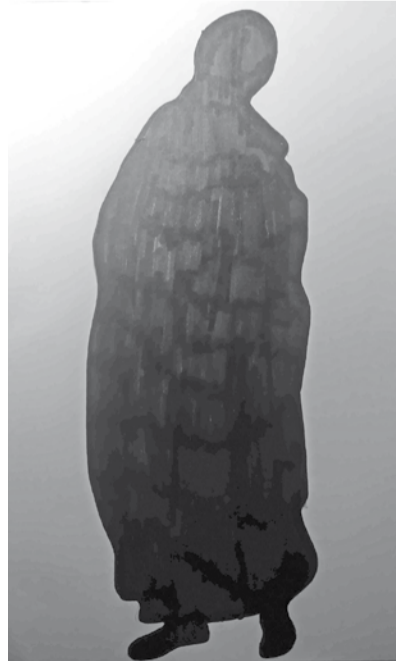
Sanija Lielupe, 9. klases skolniece