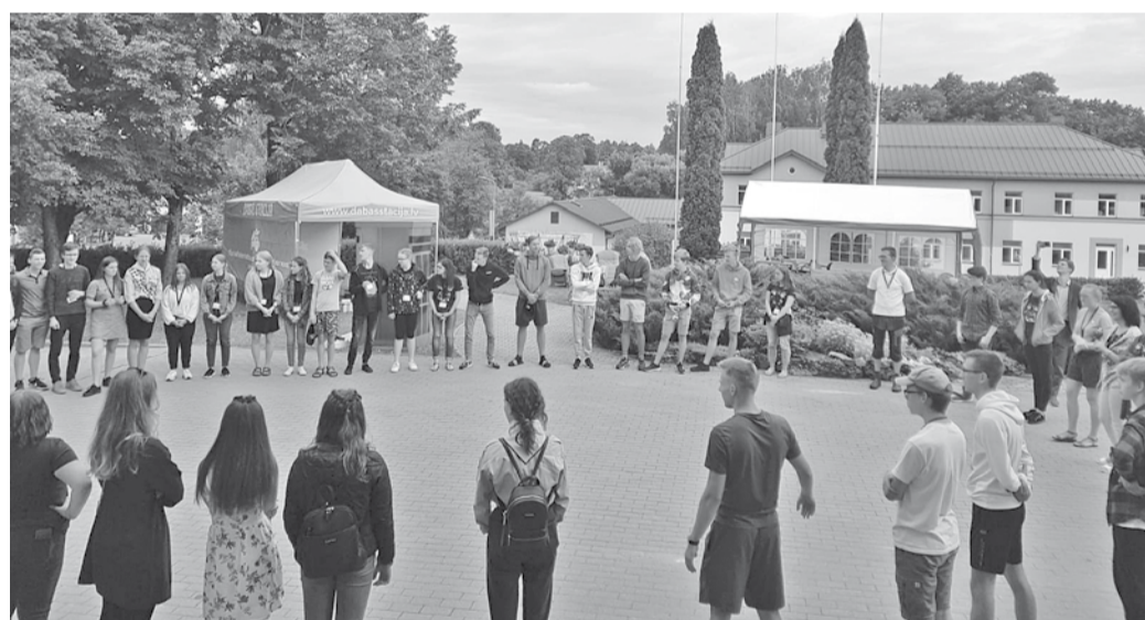
IMPACT „Satver brīvību!” aktivitātes Ērgļos.

No 3. līdz 10. augustam Ērgļos norisinājās evaņģelizācijas nometne IMPACT „Satver brīvību!”, uz kuru devās septīstās dienas adventistu jaunieši no visas Latvijas. Tā norisinājās Ērgļu vidusskolā, bet daudzas aktivitātes notika gan ārpus skolas, gan Ērgļu apkārtnē.