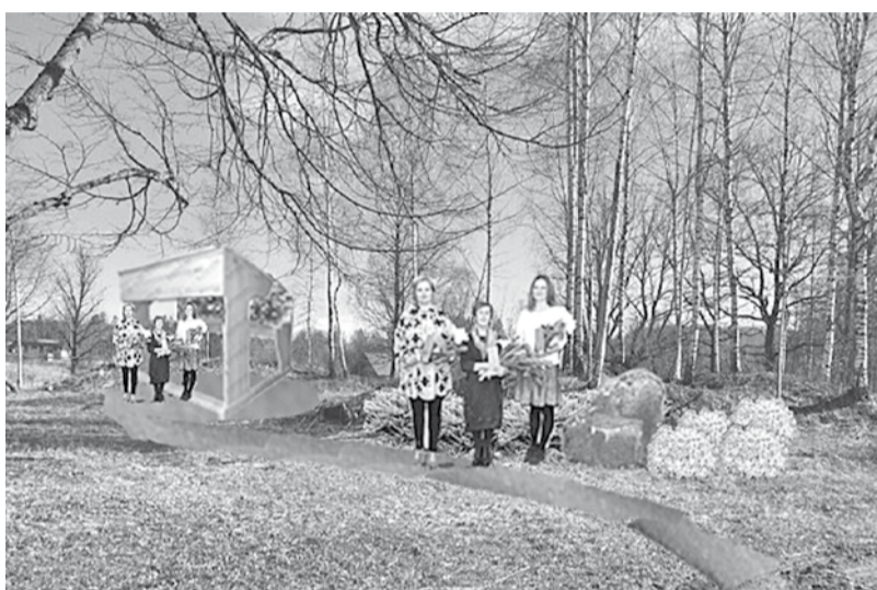
Burtņieku skolas piemiņas vietas projekta vizualizācija.

Ērgļu vidusskola atkal svin savu jubileju. Daudzi absolventi gaida jaukos tikšanās brīžus, lai dalītos atmiņās, lai redzētu, ka vecā skola ir vienmēr mainīga, vienmēr jauna. Diemžēl šogad plānoto tikšanos izjauc sērģa, šajos apstākļos nevaram nodrošināt pasākuma norisi, ievērojot vispārējos piesardzības noteikumus. Tomēr ceram satikties klātienē pēc gada.