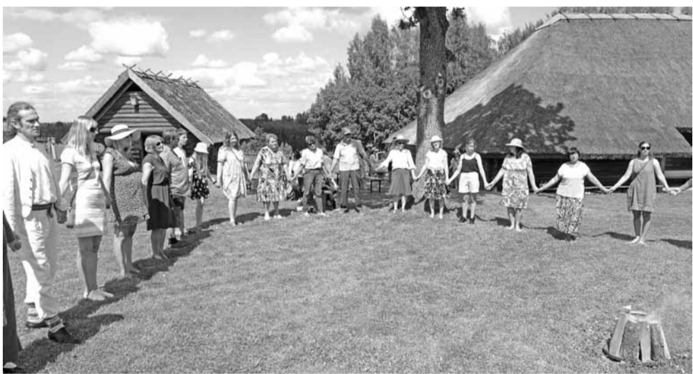
Aizdedzot Jāņu ugunsroku.

Līgo svētku gaidīšanas laiks ir apvīts ar saules mirdzumu, putnu trallināšanu, bišu sanēšanu, pļavu reibinošo smaržu un pirmo zemeņu garšu. Šogad nedaudz citāds - tāds atturīgs, attālināts un neziņā tīts. Ērgļu novada „Braku” muzejā ik gadu ir līgots, dziedāts un aizdegts ugunsroks, un arī šogad 22. jūnijā notika skaista un sirsniņa Jāņu ielīgošana.