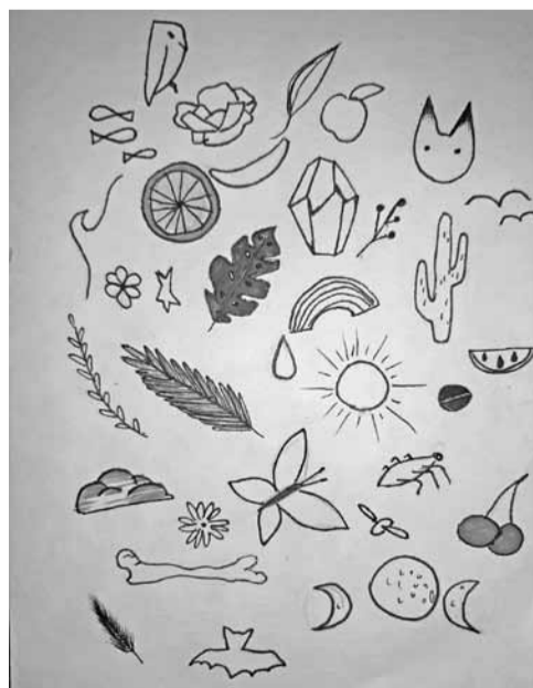
Plakāts Vasara - Egita Vaska, 9. klases skolniece