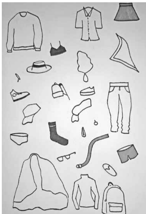
Plakāts Skolas Apģērbs – Asne Stankevičs, 9. klases skolniece