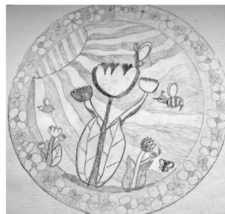
Guste Strazdiņa Ērgļu vsk. 2. klase