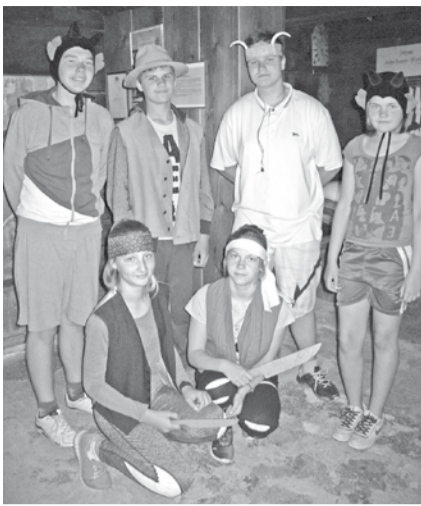
„Brakos” ir iemīļotas „Velniņu” ekskursijas.

Materiālu apkopēja un fotografēja Zinta Saulite , „Braku” muzeja vadītāja