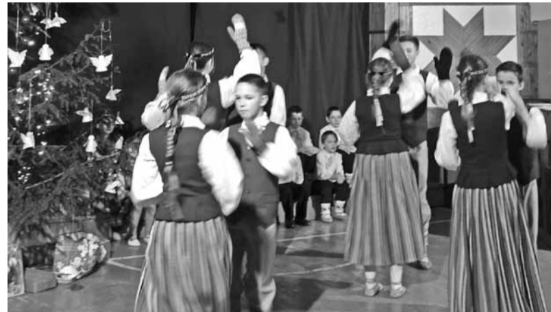
6. - 9. kl. tautisko deju kolektīvs 2016. gada Ziemassvētku eglītes pasākumā.

Savukārt lielāko klašu skolēniem patīk būt kopā arī ikdienā, ne tikai uzstāšanās reizēs. Šogad ar 6.-9. klases deju kolektīvu ir ļoti patīkami strādāt. Skolēni grib sagatavot kvalitatīvu priekšnesumu, viņos ir atbildības sajūta par savu sniegumu, un viņi cenšas apgūt deju tā, lai skatītājiem, uz viņiem skatoties, būtu prieks. Pieci no deju kolektīva bērniem mācās 9. klasē, tāpēc ir aizņemti, sekmīgi apgūstot mācību vielu un gatavojoties eksāmeniem, taču viņi ir atraduši laiku, lai dejotu un priecētu sevi un citus.