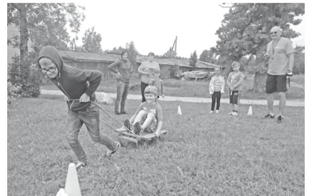
Disciplīnas „Veiklā ragaviņa” dalībnieki.

Agita Opincāne Jumurdas pagasta pārvaldē