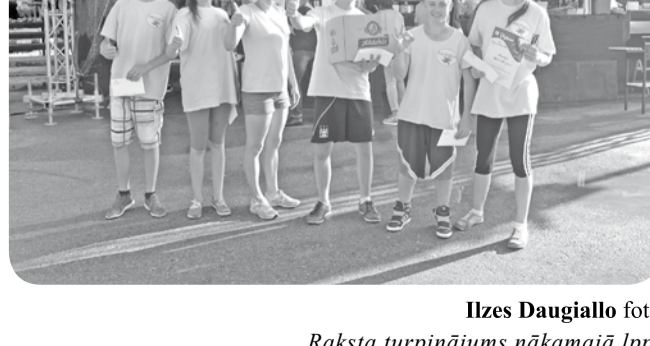
Raksta turpinājums nākamajā lpp.